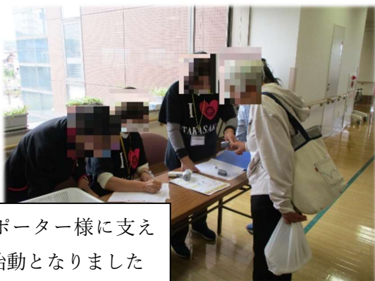
沢山のサポーター様に支えられての始動となりました

地域の方々が自然と集まり、楽しみながら健康づくりができる場所として、そして人と人がつながる温かいコミュニティとして、「 ときめきボノ倶楽部 」を育てていきたいと考えています。皆さまのご参加を心よりお待ちしております。