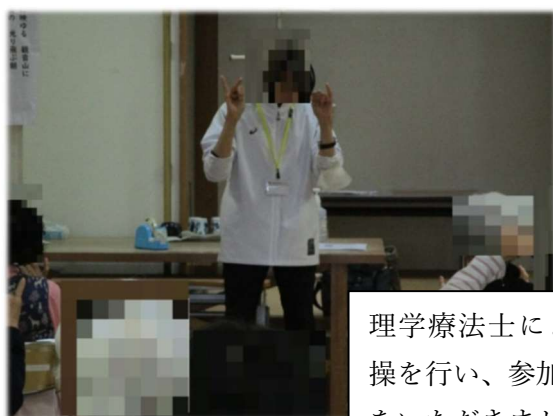
理学療法士による独自の介護予防体操を行い、参加者の方から大変ご好評をいただきました