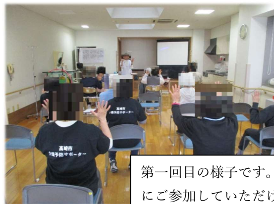
第一回目の様子です。多くの方にご参加していただきました